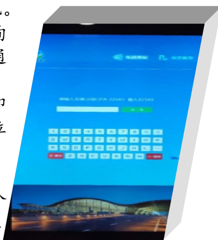
(供稿: 摘自媒体报道)

下一步，反向寻车系统将会进一步覆盖整个浦东机场停车库，并相继推出网上APP，旅客在手机上就可以查到车位的位置，体验感更好。